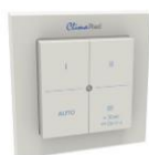
Vierstandenschakelaar in de keuken