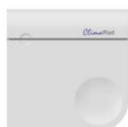
CO 2 sensor hoofdslaapkamer